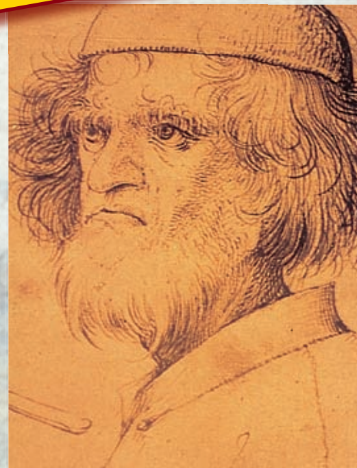
Pieter Bruegel de Oude, Graphische Sammlung, Wenen

DVD 2 PARTS NEDERLANDS · FRANÇAIS · ENGLISH · DEUTSCH