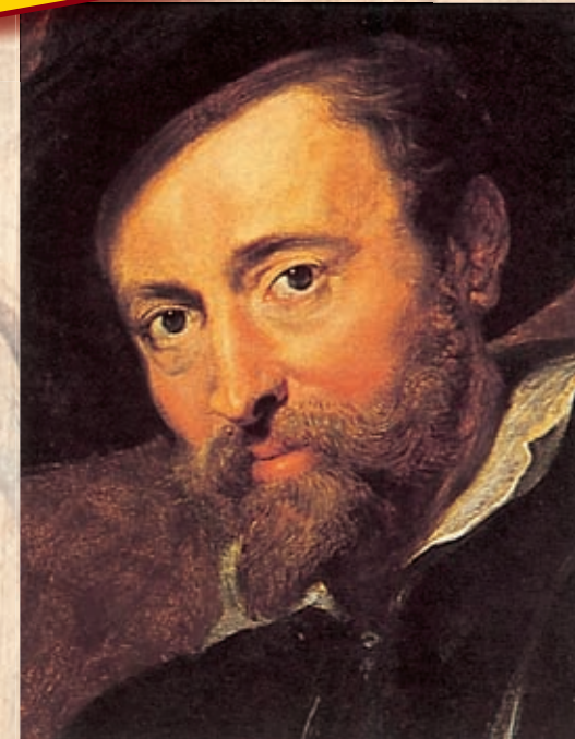
Pieter-Paul Rubens, Rubenshuis, Antwerpen

DVD 2 PARTS NEDERLANDS · FRANÇAIS · ENGLISH · DEUTSCH